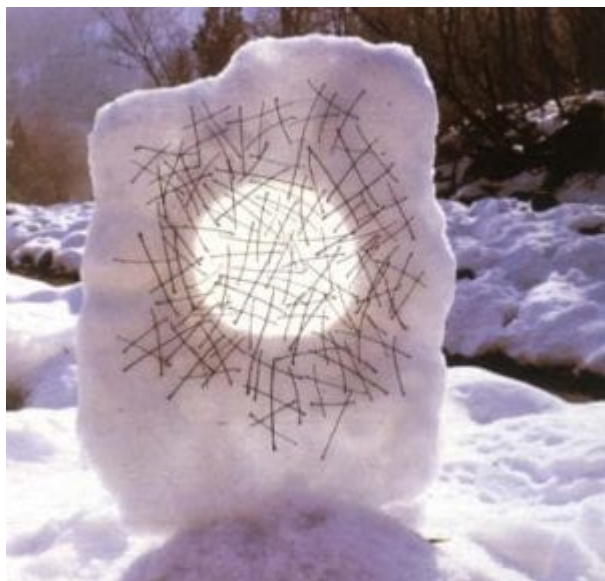
Andy Goldsworthy - Ice Twigs (Ledové snítky), 1999

Ironií pak samozřejmě zůstává, že zatímco konceptuální umělci vytvářejí díla, která jsou přinejlepším nejasnou, rozpolcenou a vágní kritikou komodizované kultury, v marketingu svých prací coby nesmírně nákladných komodit jsou skutečně jen těžko překonatelní odborníci. Bez výjimky jde o nepřiliš kultivované profesionální obchodníky, kteří za přemrštěné sumy prodávají pseudorebelii . Z tohoto úhlu pohledu můžeme dílo Longa a dalších umělců tvořících land art označit za přenesení prostředí a zvyklostí galerií do přírody (nebo naopak).