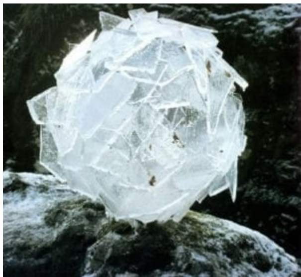
Andy Goldsworthy - Ice Ball (Ledová koule)

Když užívám výraz „posvátný“ ( numinous ), nemám na mysli nějakou vágní duchovnost či postmoderní výklady náboženství. Zajímá mě posvátno v tom významu, který popsal teolog Rudolf Otto. Ve svém díle Das Heilige - Über das Irrationale in der Idee des Göttlichen und sein Verhältnis zum Rationalen užívá Otto pojem posvátno k popisu náboženství v jeho rané, nejživotnější vývojové fázi. Právě tehdy dochází k přímému střetnutí se „zcela odlišným,“ tím co se nachází mimo přirozené formy. Náboženství postupem času část této vitality ztrácí a prostřednictvím morálních kodexů a esoterických rituálů kostnatí. Přímou zkušenost posvátna však člověk pociťuje jako děsivé, zdrcující setkání s čímsi, co se vynořuje z přírody, ale existuje mimo ni a není z ní odvoditelné. Posvátno se tedy nerovná uctívání přírody, ale může existovat vedle něj. Důležité je, že se jedná o projev čehosi mimo přírodní svět, mimo rámec našeho omezeného chápání, což mu dodává jeho bázeň vyvolávající charakter.