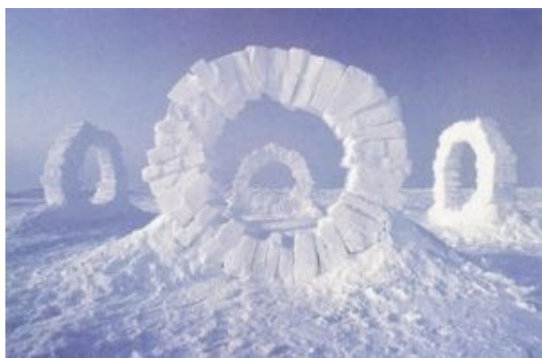
Andy Goldsworthy - Touching North, North Pole (Dotýkat se severu, Severní pól), 1989

V tomto díle není nic, co by se přirozeně nevyskytovalo v přírodě; nic umělého v tomto slova smyslu. Přesto na fotce nacházíme cosi z palety tvůrce olejomalb. Jde o druh jasné červeně, kterou si člověk spojuje s renesančními malíři – což nás opět přivádí do samotného srdce umělecké praxe Andyho Goldsworthyho. Jeho práce organizuje a vede přírodní objekty tak, že se znovu rodí coby objekty umělecké. Měli bychom zdůraznit, že tak činí zcela bez namyšlenosti; neukazuje arogantně prosté předměty se slovy „toto se od nynějška stává uměleckým objektem, neboť já – umělec – to za něj označuji.“ Namísto toho pomáhá vystoupit ze svých nejbližších souvislostí na povrch pozoruhodným formám. Usiluje o zdůraznění toho, co už je implicitně přítomné.