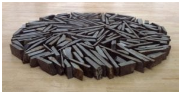
Richard Long - South Bank Circle

Ovlivněn konceptuálními umělci a performery jako Joseph Beuys a Yves Klein brzy začal považovat ateliér umělecké školy za příliš klaustrofobický a rozhodl se tvořit pod otevřeným nebem v Morecambe Bay. „Vzpomínám si na první den na pláži, bylo mi vcelku jedno, na čem dělám - byl jsem venku a začínal se učit... pláž je skvělý učitel o pojmu času - příliv si vezme vaši práci, což funguje jako skvělý termín uzávěrky.“ [1] Toto krátké hodnocení více méně shrnuje přetrvávající Goldsworthyho přístup k práci. Jeho výtvořby bývají zpravidla prchavá díla vytvořená z přírodních materiálů nalézáných in situ . Drtivou většinu jeho prací nenajdeme v galeriích, ale v přírodě. Často je nevidí (a nevyfotí) nikdo kromě autora samotného.