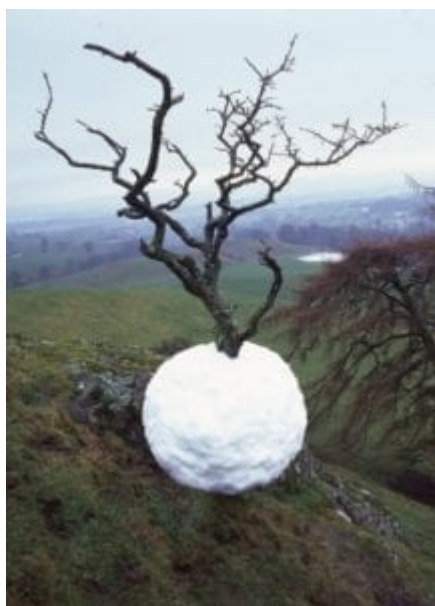
Andy Goldsworthy - Ice Ball (Ledová koule)