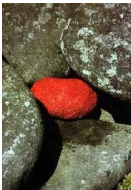
Andy Goldsworthy – Rock Poppy Petals

Goldsworthy také často vytváří umění z listů a okvětních lístků. Někdy jde o obalení kamene do listů či okvětních lístků určité barvy, jindy o trnem nebo stonkem sešitou šňůrku listů nebo listy položené tak, aby vytvořily určitý barevný vzorec. Kámen pokrytý plátky vlčího máku je pozoruhodný svým živým zbarvením, zdůrazněným okolní šedí. Čím víc se na něj díváte, tím jasněji si všímáte, že se zdaleka nejedná o monochromatickou jednotvárnost, ale o detailní vzorec modré, zelené modrošedé a bílé pokrývající kamení. Pronikavě rudý vlčí mák to díky ostrému kontrastu a srovnání pomáhá zdůraznit. Goldsworthy nechce jen ukázat pěknou věc, ale nutí vás podívat se blíže na to, co už na jejím místě bylo dříve.