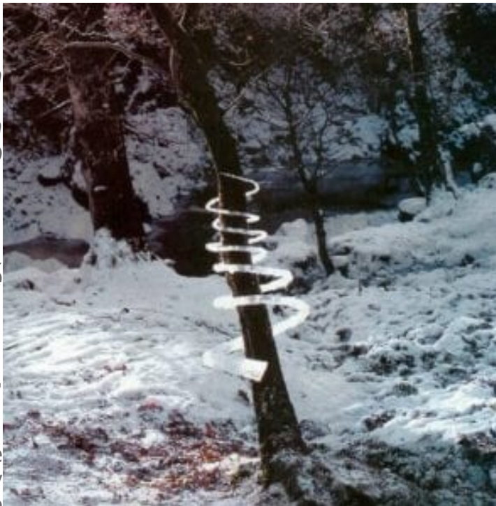
Andy Goldsworthy - Icicle Spiral ( Treesoul ) / Ledová spirála - Duše stromu /, Dumfriesshire, Skotsko.

Vyrobil ji ze sesbíraných rampouchů, které následně částečně rozpustil, aby mohly znovu přimrznout k jiným. Takto dokáže Goldsworthy vytvářet formy, které by se samy od sebe v přírodě nevyskytly, ale které v přírodním prostředí nepůsobí jako pěst na oko. Jde o typické Goldsworthyho