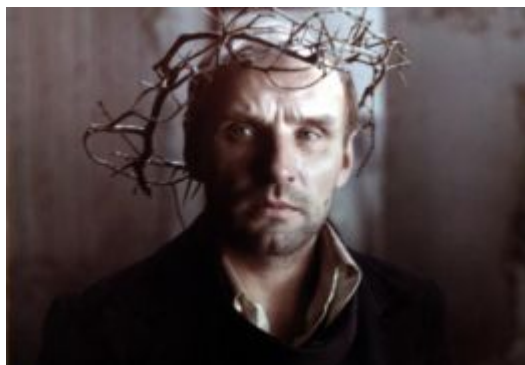
Anatolij Solonicyn jako Spisovatel ve Stalkerovi