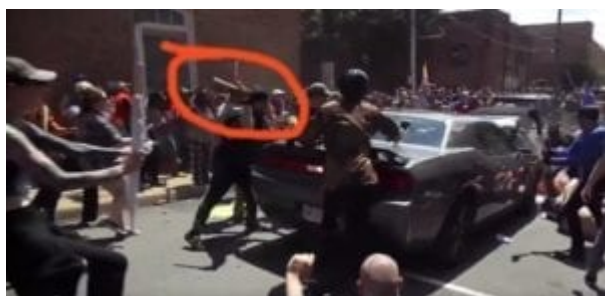
Mírumilovná protidemonstrace za rovnost a rasovou snášenlivost.

Kolem tři čtvrtě na dvě toho dne se stal dvacetiletý James Fields, který do Charlottesville přijel kvůli Unite the Right, účastníkem srážky aut, při níž zemřela žena, a 19 dalších lidí bylo zraněno. Podle dostupných videozáznamů události Fields projížděl ulicemi města normální rychlostí, když na jeho auto podle všeho zaútočili levicoví demonstranti. Zřejmě ze strachu o svou bezpečnost šlápl Fields na plyn a narazil do auta před sebou. Další video pak jasně ukazuje, jak se na jeho vůz zezadu řítí vlna násilníků, Fields řadí zpátečku a z místa ujíždí. Fields byl obžalován z vraždy druhého stupně. Levicový i pravicový lynčující dav zástupců establishmentu samozřejmě zcela odvrhl zásadu presumpce nevinny a Fields byl tak označen za „teroristu“ , o němž se mluví jako o „Jamesi Alexi Fieldsovi“ - jako by to byl druhý Lee Harvey Oswald.