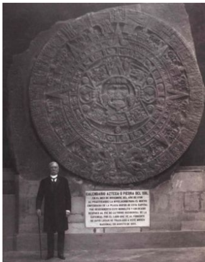
La piedra del Sol (aztécký „kalendář“)

V náboženství starého Mexika také existovaly mýty o ztracené bájně pravlasti, čtyřech či pěti kosmických věcích (čtenář jistě vzpomene na Hésiodovo patero věků), čtyřech generacích bohů, čtyřech lidstvech, jejich záhubě a očekávání brzkého konce světa. Podle znalců aztécké mytologie je na aztéckém slunečním kameni ( La piedra del Sol ) znázorněno tzv. „páté slunce“, s nímž přijde pátý věk. Pátému slunci z úst vychází (obsidiánový) nůž, který připomíná jazyk.