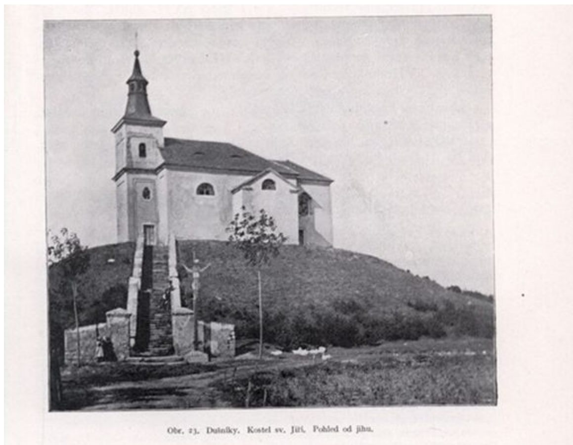
Obr. 23. Dušníky. Kostel sv. Jiří. Pohled od jihu.

Je pozoruhodné, že i v Čechách existují jakési „pyramidy“, na které upozornil badatel Otomar Dvořák ( Kamenné otazníky české historie ). Jde o uměle navršené pravěké mohyly ve stylu Silbury Hill, které jako by napodobovaly Říp, centrální posvátnou horu kmene Čechů (etymologie jména Říp je před slovanská a znamená prostě „hora“). Otomar Dvořák zkoumal zejména mohyly v okolí Prahy: Dušníky, Libomyšl a Lichoceves (v Libomyšli geofyzikální prospekce umělý původ vyloučila, ale mohyla v Dušnicích u Rudné dodnes stojí a na vrcholu byla dokonce už kdysi vybudována kaple).