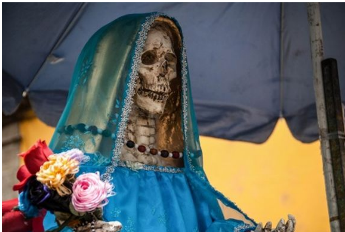
Panna Maria přeznačená v novodobé mexické božstvo Santa Muerte (Svatá Smrt)

Neučinil Fernando Cortés v Mexiku vlastně totéž, co kdysi král Jósijáš v Judsku?