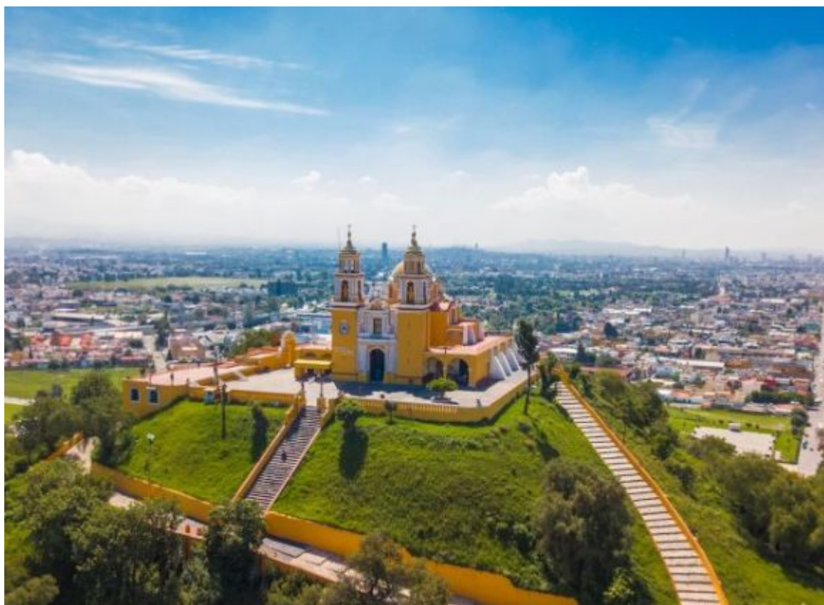
Pyramida v Cholule se španělským kostelem na vrcholku

V Mexiku se nachází dokonce i největší pyramida na světě – pyramida v Cholule se základnou 450 metrů a výškou 62 metrů, na jejímž vrcholku Španělé provedli planýrku a vystavěli zde barokní kostel (pyramida byla zasypána hlínou, opuštěna a porostlá vegetací již před příchodem Španělů). V Guatemale byla v tropickém deštném lese objevena májská pyramida La Danta, jež byla podle současných rekonstrukcí dokonce o třicet metrů vyšší a mohutnější než Cheopsova i Chefreova.