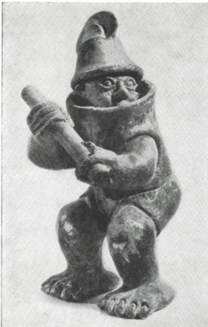
47 Hliněná plastika muže, snad hráče hry míčové v ochranném oděvu

Terakotový hráč aztécké míčové hry