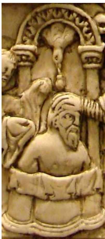
Detail slonovinové řezby, původně snad knižní desky, z devátého století zachycující přílet holubice se svatou ampulkou