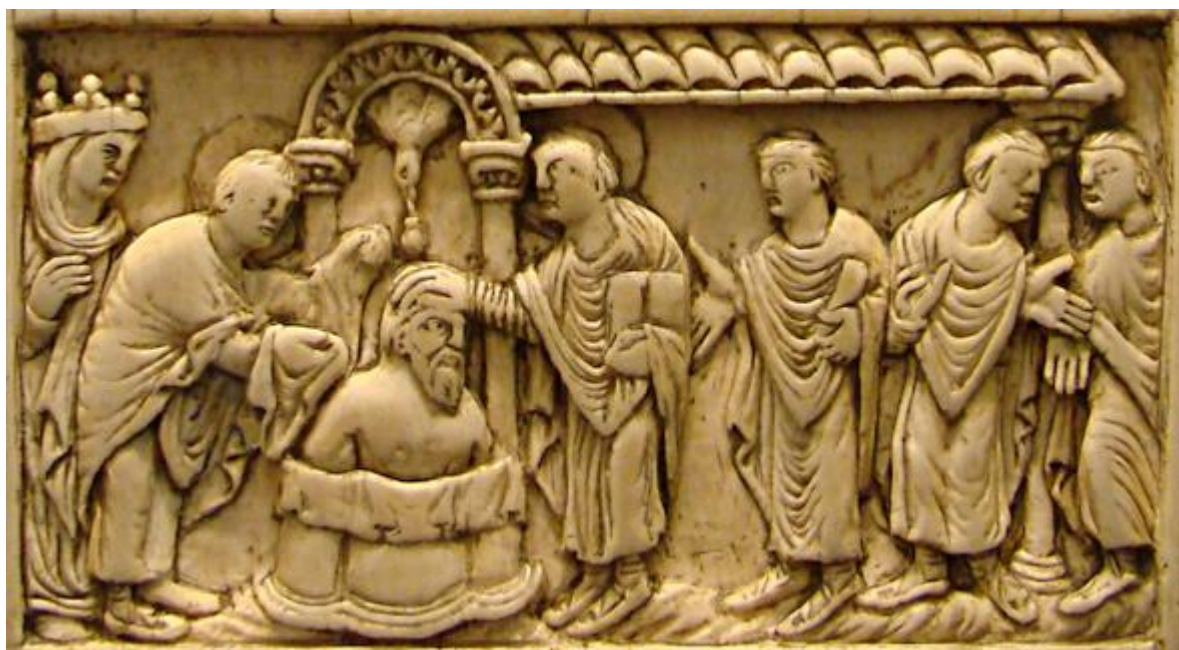
Svatý Remigius křtí Chlodvíka