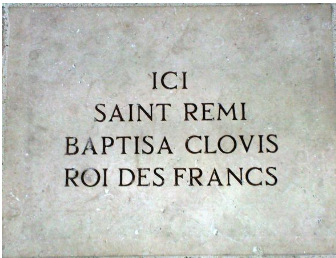
Místo křtu označuje v katedrále kamenná deska