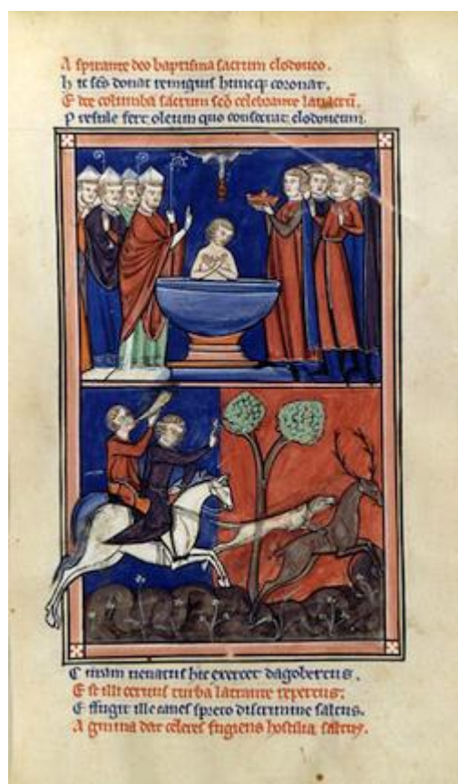
Křest krále Chlodvíka I.

A právě tehdy se přihodila neobvyklá událost, o níž se v 9. století zmiňuje Hinkmar, arcibiskup remešský, ve svém díle Život svatého Remigia a o níž se bude hovořit se vši vážností ještě o tisíc tři sta let později, za Francouzské revoluce.