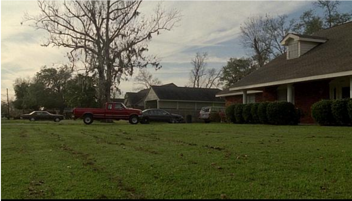
Vize Ameriky před kolapsem - Martyho tradiční Amerika: „Svůj trávník si seču sám“.

Rust Cohle je noční protikladem Martyho, symbol rozkladu a chaosu Ameriku po kolapsu. Americký sen podle něj vždy byl jen chimérou. Marty svým kolegům detektivům popisuje Cohleovu „vychrtlou“ divokost, kvůli které mu „trvalo tři měsíce, než se mu ho povedlo pozvat k sobě domů na večeři“. Rust žije mimo společnost, bez rodiny nebo televize, neuznává institucionální řád („Kdo je kurva Eddy?“) ani mýtus o pokroku („Čas je placatý kruh“). Jeho domov je spartánský, bez domácích pozlátek amerického snu a s ním spojených melodramatických rozptýlení. Cohleův život jako „nekonečné defilé násilí a ponížení“ - opustila jej matka, vychoval ho veterán z Vietnamu a přišel o dceru i manželku - mu dává „opravdový vhled“ do jejich případu.