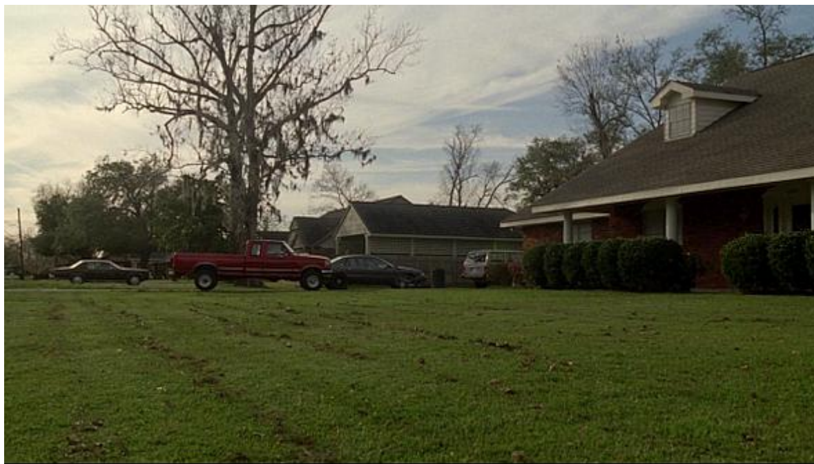
Vize Ameriky před kolapsem - Martyho tradiční Amerika: „Svůj trávník si seču sám“.

Rust Cohle je nokturnálním protikladem Martyho, symbol rozkladu a chaosu Ameriku po kolapsu. Americký sen podle něj vždy byl jen chimérou. Marty svým kolegům detektivům popisuje Cohleovu „vychrtlou“ divokost, kvůli které mu „trvalo tři měsíce, než se mu ho povedlo pozvat k sobě domů na večeři“. Rust žije mimo společnost, bez rodiny nebo televize, neuznává institucionální řád („Kdo je kurva Eddy?“) ani mýtus o pokroku („Čas je placatý kruh“). Jeho domov je spartánský, bez domácích pozlátek amerického snu a s ním spojených melodramatických rozptýlení. Cohleův život jako „nekonečné defilé násilí a ponížení“ - opustila jej matka, vychoval ho veterán z Vietnamu a přišel o dceru i manželku - mu dává „opravdový vhled“ do jejich případu.