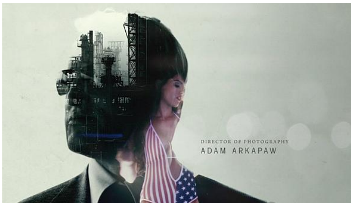
Temný případ: Uvodní fotomontáž ropné rafinerie a stiptýzového klubu 1]