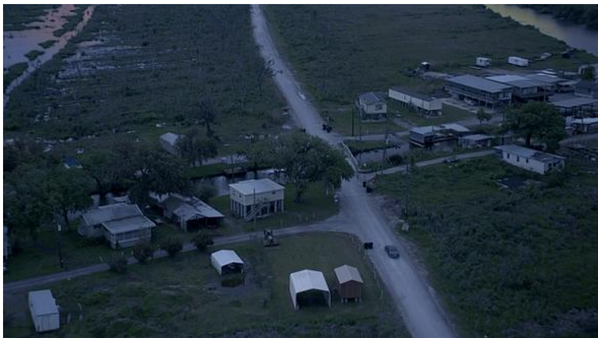
Temný případ: Tenká linie mezi divočinou a civilizací

Dramatické a imerzivní vzdušné záběry louisianských močálů ( bayou ) slouží jako kontrapunkt k prudké filozofické dialektice 2] mezi Martym a Rustem. Nejasná linie mezi předměstími a močály zvýrazňuje křehkost hranice mezi civilizací a divočinou a nasměrovává naši pozornost k bodu, v němž domácí život končí a divočina se ujímá vlády.