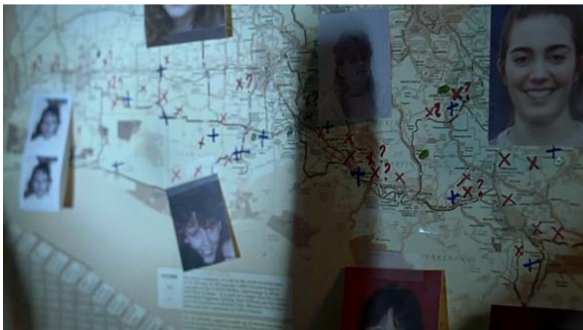
Krajina jako symbol zmizelých a bezprávných.

Louisianská krajina, „ani voda ani pevná zem“, se tak stává roztržštěným zrcadlem, do něhož si promítáme svou mizející budoucnost. Krajina promlouvá smyslově, písněmi otroků, symboly, talismany a rituály původního obyvatelstva – stopami kultur a zvyků vymýcených genocidními ekonomikami starého Jihu a expanze na Západ. Když tak Rustův zrak spočine na billboardu se zmizelými dětmi, na němž stojí „Kdo mě zabil?“, promlouvá k nám současně hlas naší budoucnosti i minulosti.