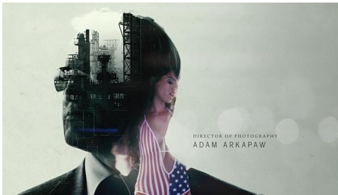
Temný případ: Uvodní fotomontáž ropné rafinerie a stiptýzového klubu 1]