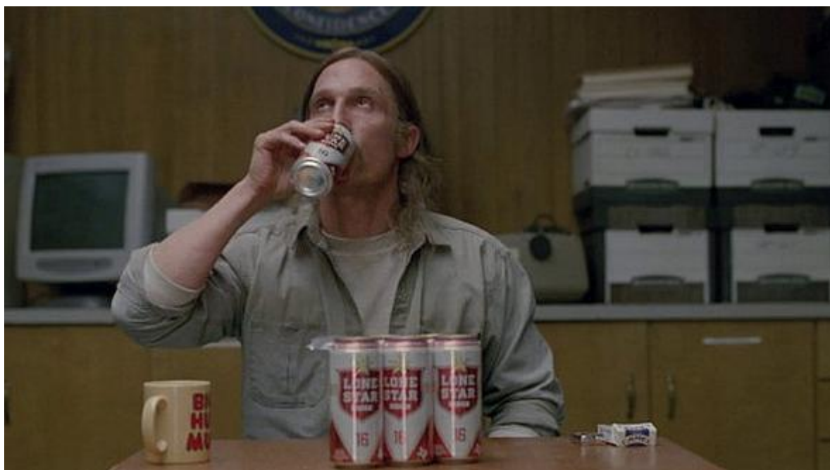
Karikatura Osamělého jezdce (Lone Ranger): Rusty jako paobraz Martyho - Osamělá hvězda (Lone Star)

Marty je „obyčejný člověk“, domestikovaný hraničář a strážce společenského řádu – a to i poté, co se mu zhroutí osobní život. Když odejde od louisianské státní policie a zakládá si své vlastní podnikání jako soukromý detektiv v „Hart Investigative Solutions,“ jedinou dekorací jeho kanceláře je plakát rodea „Cheyenne Frontier Days“. V letech následujících po svém rozvodu jí večer u kovbojek „mražené hotovky“ (TV dinner). Když se znovu dává dohromady s Rustem, aby splatili svůj „dluh“ a společně se soustředili na vyřešení případu, mluví za celou svou tradiční Ameriku, když se Rustovi svěřuje, že „nakonec se staneš něčím, cos vůbec neplánoval, aniž bys vlastně věděl proč“.