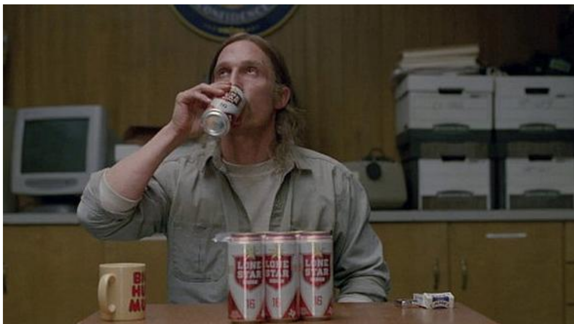
Karikatura Osamělého jezdce (Lone Ranger): Rusty jako paobraz Martyho - Osamělá hvězda (Lone Star)

Marty je „obyčejný člověk“, domestikovaný hraničář a strážce společenského řádu – a to i poté, co se mu zhroutí osobní život. Když odejde od louisianské státní policie a zakládá si své vlastní podnikání jako soukromý detektiv v „Hart Investigative Solutions,“ jedinou dekorací jeho kanceláře je plakát rodea „Cheyenne Frontier Days“. V letech následujících po svém rozvodu jí večer u kovbojek „mražené hotovky“ (TV dinner). Když se znovu dává dohromady s Rustem, aby splatili svůj „dluh“ a společně se soustředili na vyřešení případu, mluví za celou svou tradiční Ameriku, když se Rustovi svěřuje, že „nakonec se staneš něčím, cos vůbec neplánoval, aniž bys vlastně věděl proč“.