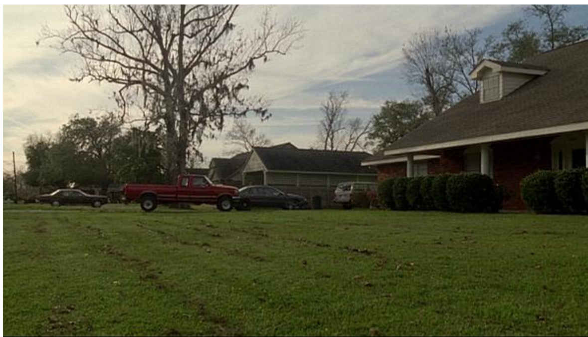
Vize Ameriky před kolapsem - Martyho tradiční Amerika: „Svůj trávník si seču sám“.

Rust Cohle je nokturnálním protikladem Martyho, symbol rozkladu a chaosu Ameriku po kolapsu. Americký sen podle něj vždy byl jen chimérou. Marty svým kolegům detektivům popisuje Cohleovu „vychrtlou“ divokost, kvůli které mu „trvalo tři měsíce, než se mu ho povedlo pozvat k sobě domů na večeři“. Rust žije mimo společnost, bez rodiny nebo televize, neuznává institucionální řád („Kdo je kurva Eddy?“) ani mýtus o pokroku („Čas je placatý kruh“). Jeho domov je spartánský, bez domácích pozlátek amerického snu a s ním spojených melodramatických rozptýlení. Cohleův život jako „nekonečné defilé násilí a ponížení“ - opustila jej matka, vychoval ho veterán z Vietnamu a přišel o dceru i manželku - mu dává „opravdový vhled“ do jejich případu.