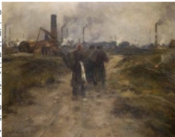
Pokrok v Kraji.

V zásadě se tedy jeho vize - podobně jako v případě sociálního učení katolické církve - soustředí na nevyhnutelné napětí mezi subsidiaritou a solidaritou; nebo, vypůjčíme-li jazyk actonovské a burkeovské politické filozofie, na napětí mezi Actonovou maximou, že „moc korumpuje a absolutní moc korumpuje absolutně“ a Burkeovou zásadou, podle níž „aby ji bylo možné požívat, musí být omezena i svoboda samotná.“ Co se Bellocova přesvědčení vyjádřeného v jeho eseji týče, ona „síla“ - jejíž využití se Richardsovi s Wittem podle všeho tolik přičí - není ničím jiným, než zakotvením spravedlivých zákonů vytvořených k znovuposílnění ekonomické svobody rodiny proti síle státu i velkého byznysu. Moji oponenti s tím mají problém, jelikož optikou svého volnotržního libertinismu chápou jakýkoliv politický zásah do hospodářské sféry jako zlo. Nemáme však žádné důkazy, že by Tolkien sdílel jejich laissez faire postoje a bylo by přinejmenším nepoctivé něco takového naznačovat.