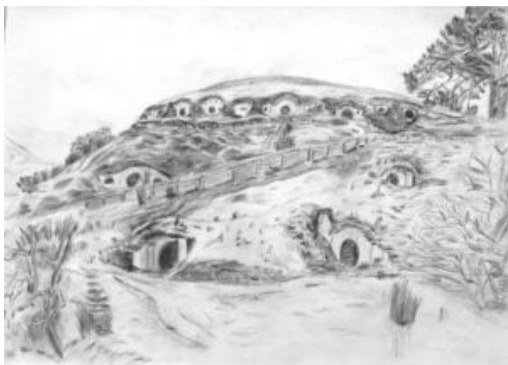
Nebo raději agrární „primitivismus“?