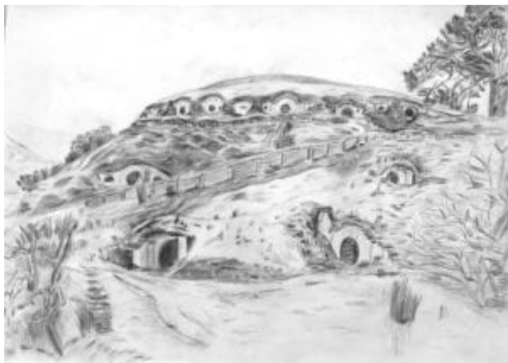
Nebo raději agrární „primitivismus“?