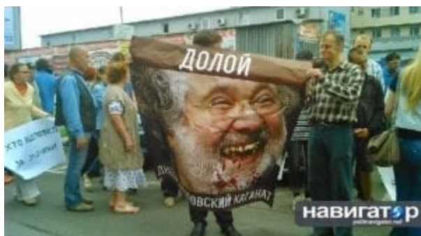
Pryč s dněpropetrovským kaganátem!

Pozor! Styl úvahy by mohl být vytríbenější, ale její celkové vyznění je celkem výstižné, protože se zamýšlí nad těmi, kteří se náhle vrhli na „záchranu bílé rasy a dalších árijských hodnot“ v žoldáckých oddílech Kolomojského a Porošenka - za hlasitého potlesku strýčka Baracka a tetiček Victorie a Jane. Autor má jistě pravdu, když říká, že jde o devaluaci „ideologického proviantu“, který poskytuje důvody k „ospravedlnění“ upřímně řečeno, otřesných „činů“. Internet samozřejmě „snese všechno“, a tedy „ve jménu bílé rasy“ je možné se smát nad, například, upálenými lidmi, nebo radostně tleskat při pohledu na mrtvé děti (podle všeho šlo o „vatniky“?) 1] v Slavjansku. Tohle má být podstata „14/88“?