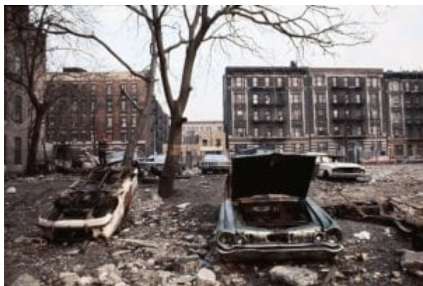
New York se od 70. let poněkud vzpamatoval...

Autoři: Gregory Hood, Henry Wolff, Paul Kersey