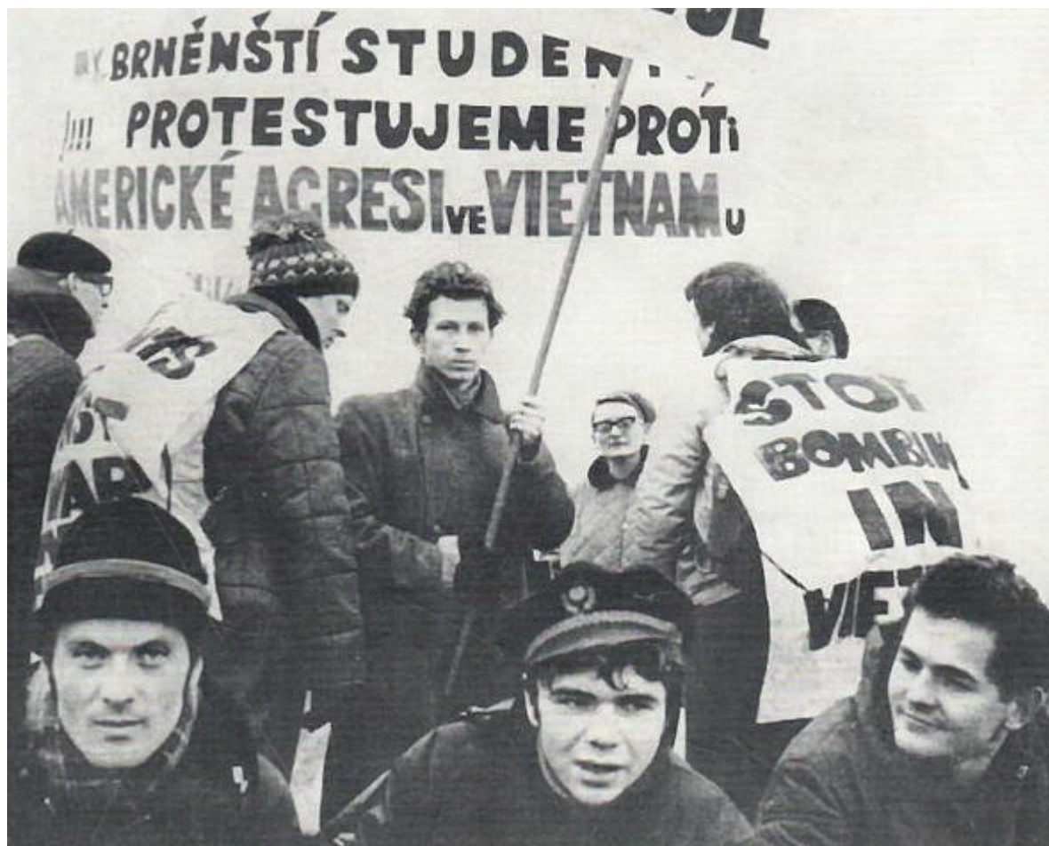
Druhá tvář „osmašedesátého“

Mythus obrození, který vystřídal mythus Masarykovy humánní demokracie, který byl vystřídán mythem protektorátního hrdinství českého odboje, který už nezadržitelně vedl k mythu „socialismu v jedné zemi“, který nezadržitelně vedl k mythu „obrodného procesu 1968“!