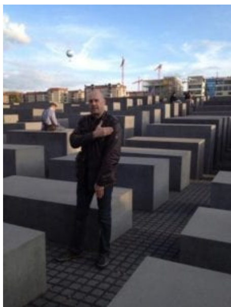
Hřích z nejsmrtelnějších

Soralova agresivita přitahuje lidi z mnoha důvodů. Tento styl je přístupný lidovým vrstvám a proto se videa šíří jak stepní oheň. Všichni lidé, kteří se kdy cítili kdy uraženi těmi, které Soral kritizuje, se cítí být pomstěni (Soral je často jediným člověkem, který se odváží určitou sortu lidí kritizovat tak napřímo). A konečně, kdokoli zná, nebo podporuje ty, které Soral kritizuje, ho díky tomuto objeví. A každá publicita je dobrá publicita – i ta negativní, a je zde jen málo lepších způsobů jak jí docílit, než vyvolávání emocí. Jak pozitivních, tak především těch negativních.