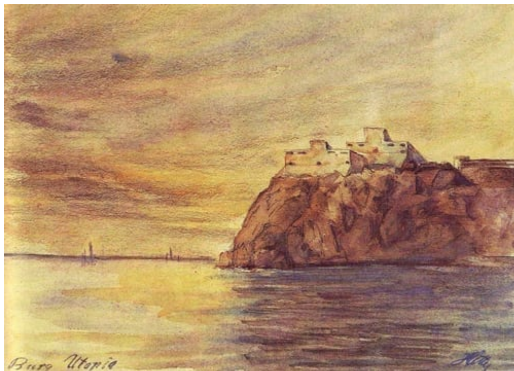
Adolf Hitler - Pevnost Utopie