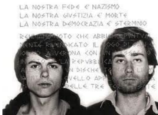
Gruppo Ludwig: 25. srpen 2014 – 37 let od prvního úderu?

V březnu 1984 navštívili dva mladíci převlečení za pieroty disko-karneval v jednom italském městečku a následně byli přistiženi, jak se v sále plném maškar pokoušejí rozlít 2 kanystry benzínu. 1] Byli však přemoženi ochrankou a oheň se podařilo uhasit, aniž napáchal velké škody. Karabiníkům ovšem dalo dost práce, aby oba mladé muže uchránili před lynčem oprávněně rozčileného davu.